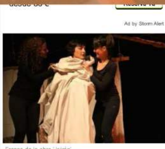
Escena de la obra 'Jairán'